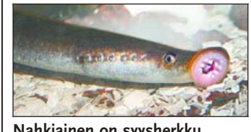
Nahkiainen on syysherku.