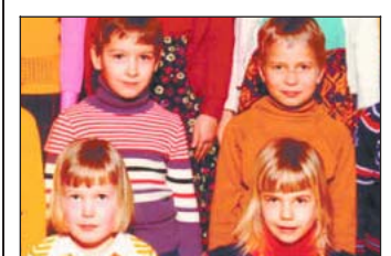
Sulkavan kansakoulun ekaluokkalaista 1974.